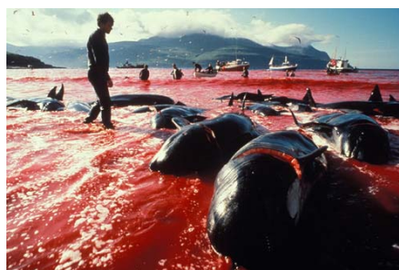
Photo à droite : LES MASSACRES EN MASSE SUR LES CÔTES DU JAPON à TAIJI / TAIJI – JAPAN COAST MASSACRES

PAUL WATSON – CO-FONDATEUR DE GREENPEACE CO-FOUNDER AND PRESIDENTS OF SEA SHEPHERD –